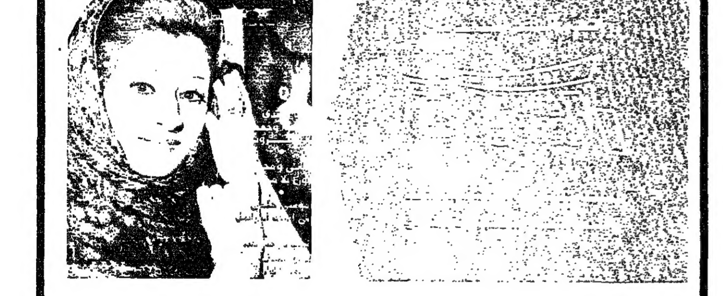
وردة ترد على السنياطي (ورد وشوك) بقلم: جورج ابراهيم الخوري

التي اشرف اليها الشيخ بيار الجميل، وليس الرئيس كرامي الذي ارتكبتها، ولكن رئيس الجمهورية المنكسر بلان الرئيس شارل حلو، الذي كان عليه ان يعين رئيس وزارة، طالما ان تعيين رئيس الوزارة هو من صلاحيات رئيس الجمهورية. يجب ان يشكر الرئيس كرامي الذي قبل بانه يستعير في الحكم وهو مستقيل، وتحتل رغم استقلاله الانتقادات التي